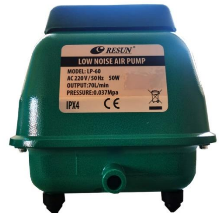
SISTEMA DE AIREACIÓN