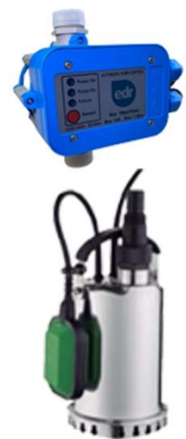
SISTEMA DE BOMBEO